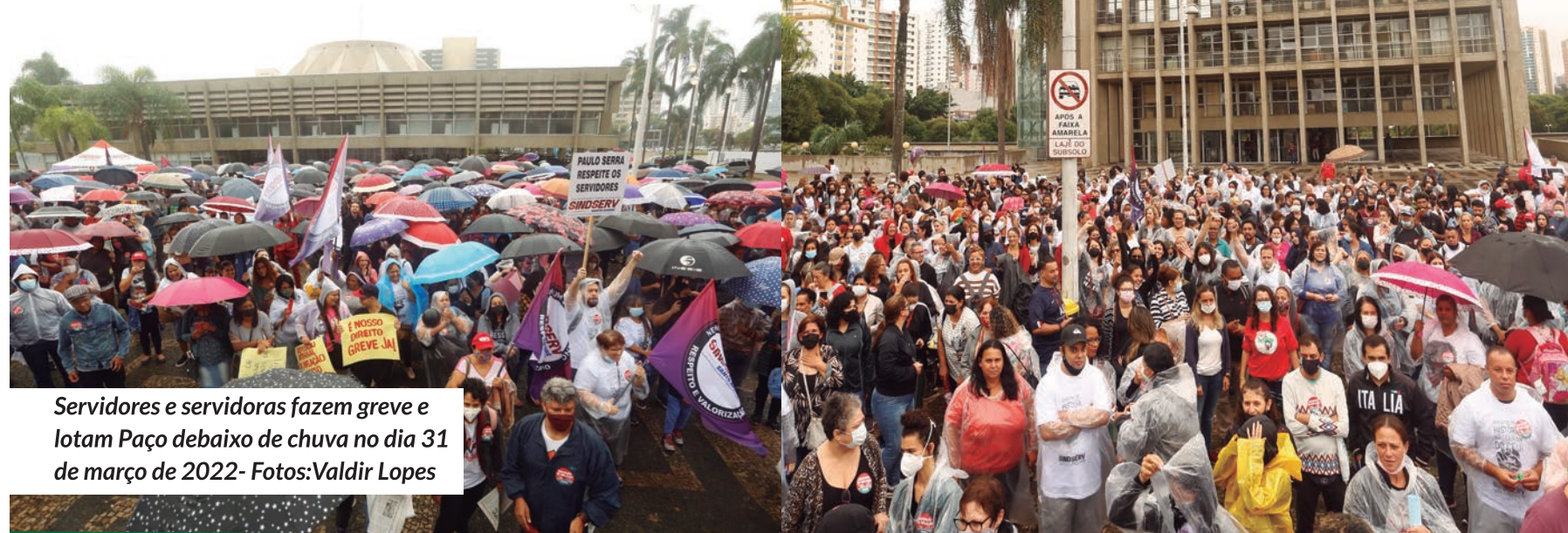
Servidores e servidoras fazem greve e lotam Paço de chuva no dia 31 de março de 2022

Em março deste ano, as negociações iniciaram. A Administração Municipal ofereceu 0% de reajuste. O Sindicato rejeitou, depois propôs 1%, depois 2% em duas vezes. Esses índices vergonhosos foram rejeitados pelo Sindicato.