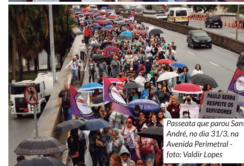
Passeata que parou Santo André, no dia 31/3, na Avenida Perimetral